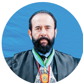
DES. GLODNER PAULETTO Corregedor-Geral